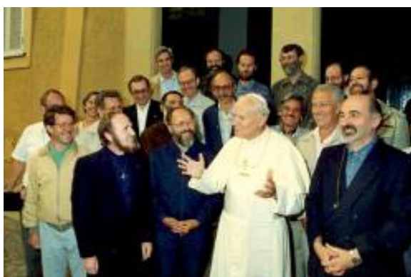
Папа Иоанн Павел II принял членов Миссии (фото летом 1989 )

Духовное и молитвенное образование требуют особо отведенного времени. Оно направлено на личное принятие истин веры и на личное преобразование своих духовных привычек. Духовное образование включает особое изучение свидетельства и посланий св. Павла, который дает основы для миссии и откроет радость и надежду, скорбь и тревогу апостольской жизни.