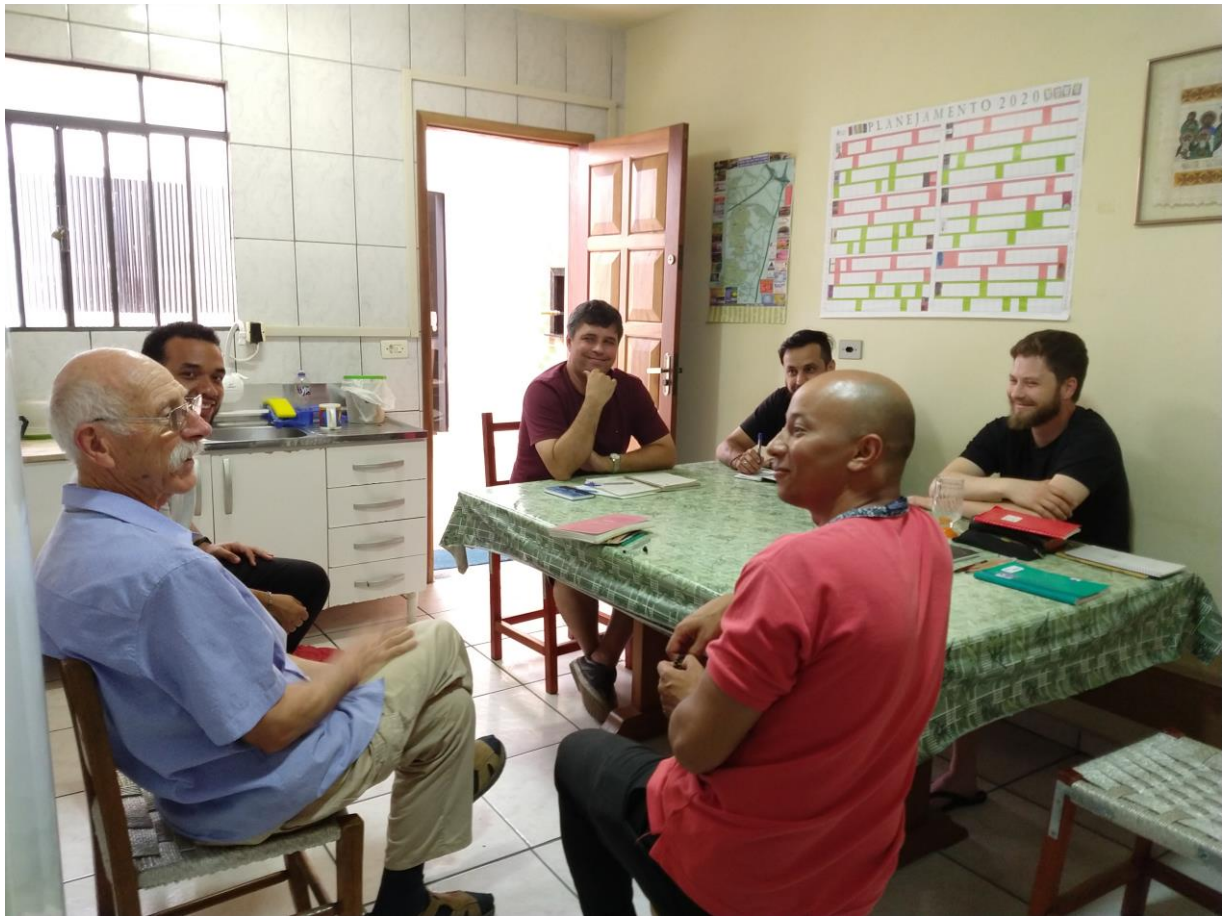
Rencontre avec les jeunes avec les Samuelinos...